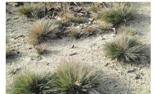
In den Sandbergen